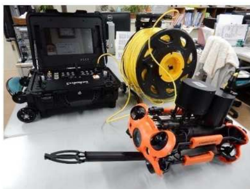
図 1 水中ドローン

突堤の二次点検は上記同様陸上からカメラ、UAV 撮影での点検および水中ドローンでの点検を想定している。