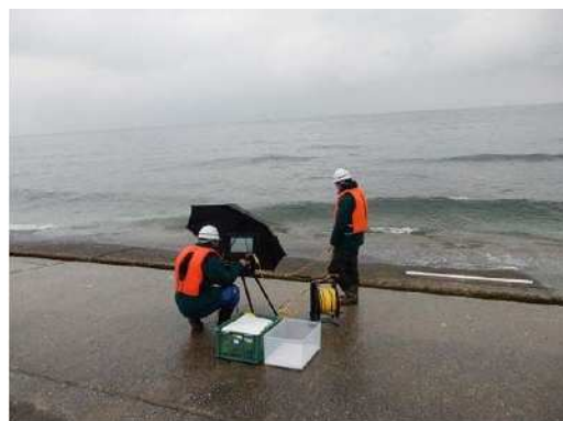
図 2 調査状況の例